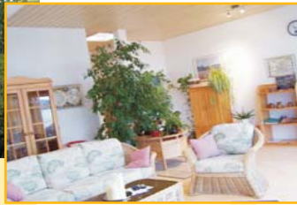
Haus 4 (117 m 2 ) 2 Schlafzimmer, 1 Doppelbett, 2 Einzelbetten